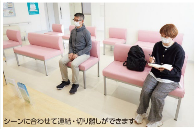
シーンに合わせて連結・切り離しができます