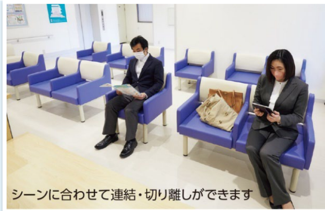
シーンに合わせて連結・切り離しができます