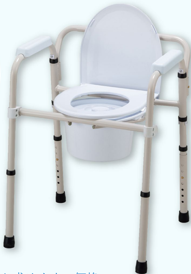
シングルユース深型便器使用例