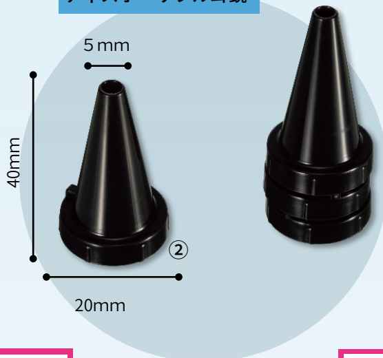
ディスポーザブル耳鏡