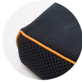
4段スムース生地 (後、左右側面は立体メッシュ生地)