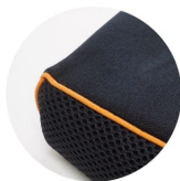
4段スモース生地 (後、左右側面は立体メッシュ生地)