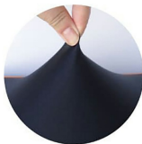
スーパーニット生地 (後、左、右側面は立体メッシュ生地)