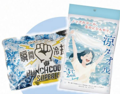
身体を冷やす アイテム