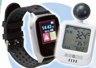
測る・知らせる アイテム