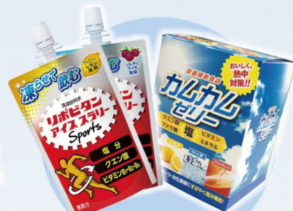
摂る・塩分補給 アイテム