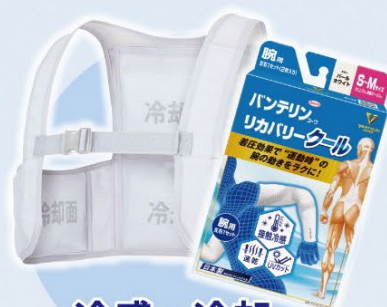
冷感・冷却 ウェア