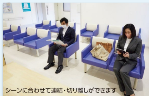
シーンに合わせて連結・切り離しができます