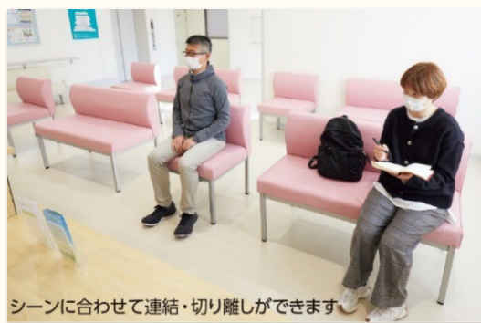
シーンに合わせて連結・切り離しができます