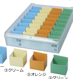
③ブルー ③クリーム ③オレンジ ③グリーン