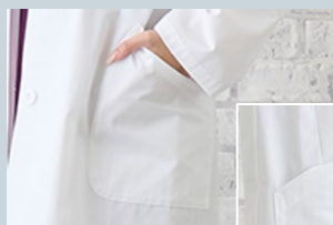
斜めに配置した サイドポケットは ミニサイズタブレット 対応サイズ