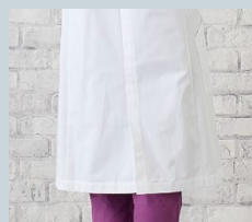
センターベント仕様で 足捌きもスムーズに