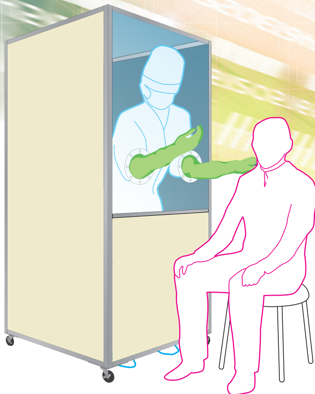
検査実施イメージ