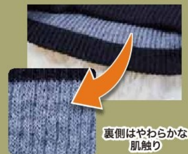
裏側はやわらかな肌触り

柔らかい風合いのバルキー糸で軽くて柔らかく保温力を高めます。 ※サーミックセレクトは三山(株)の素材です。