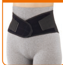
腰椎を支え 動きをサポート