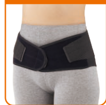
骨盤を固定し 歪みを補整