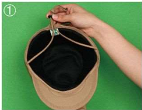
①あごひものを帽子の後ろ側へ