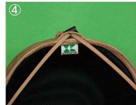
④ループとドロコードで固定