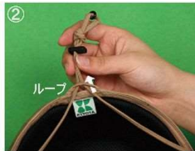
②あごひものを下からループへ通す