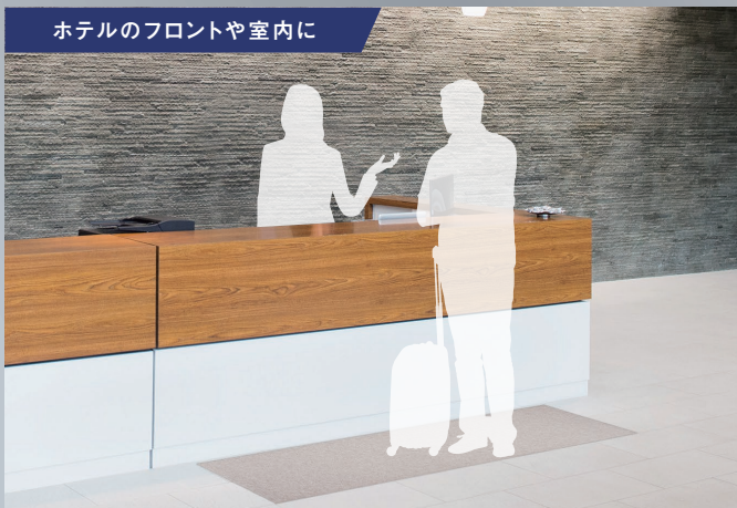
ホテルのフロントや室内に