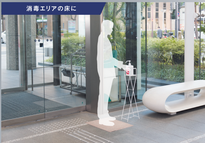
消毒エリアの床に