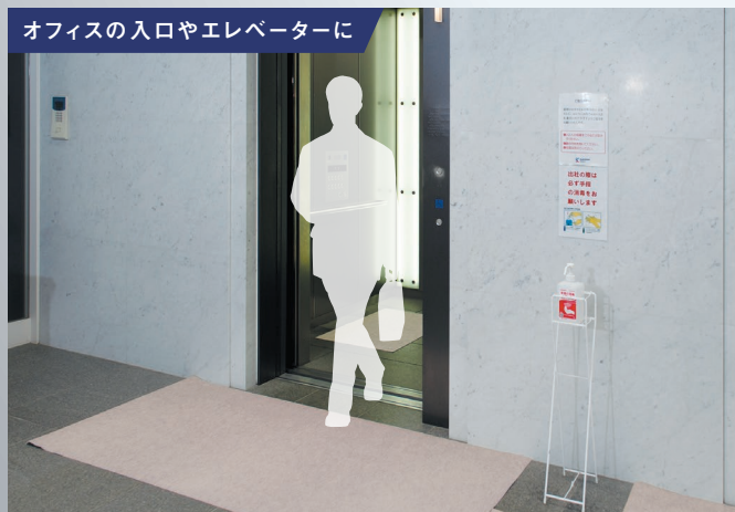
オフィスの入口やエレベーターに